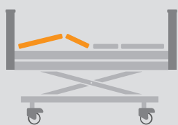
REGULACJA SEGMENTU NÓG