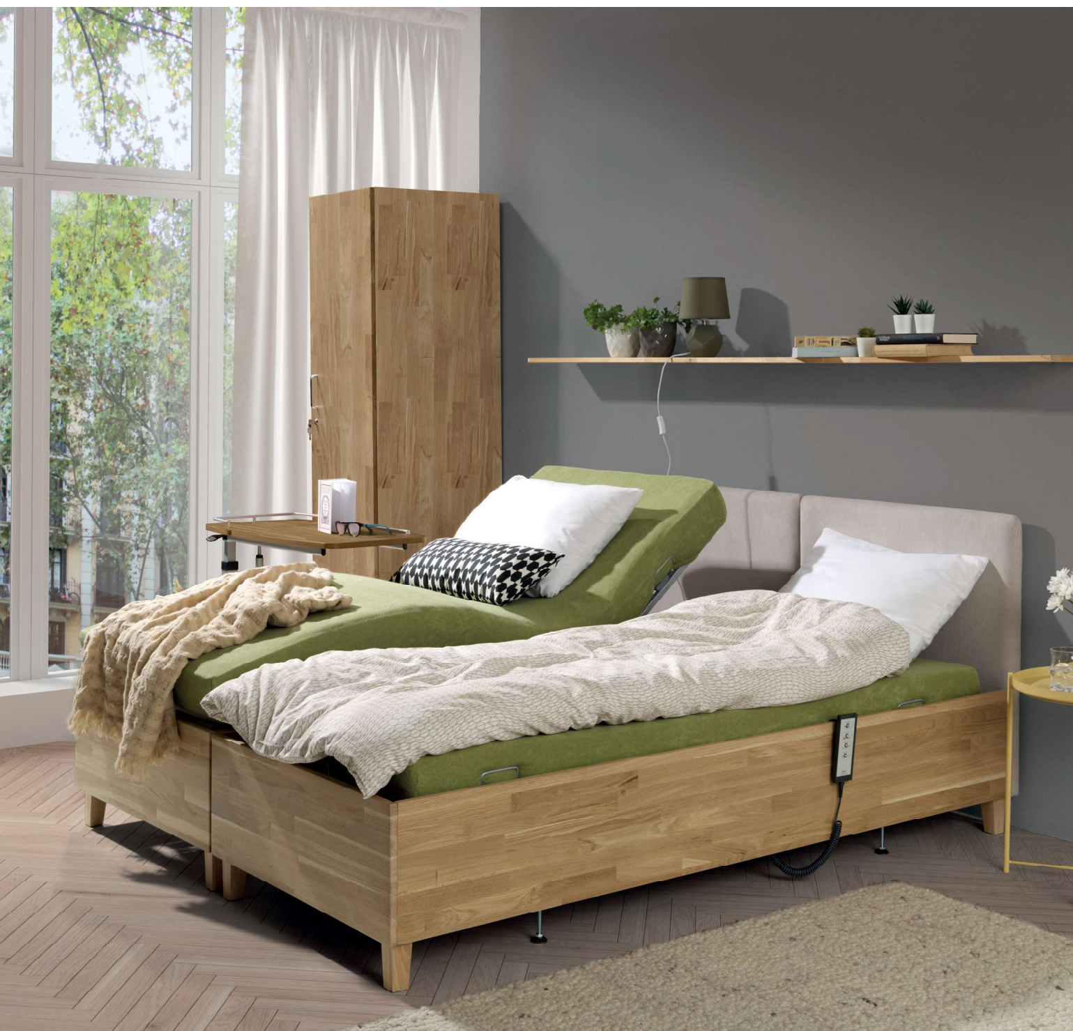
Na zdjęciu: Dwie obudowy dębowe PB 532 z wkładami PB 521. Akcesoria: Stolik Rubens 3 w kolorze dąb jasny.

Obudowa PB 532 wraz z wkładem PB 521 to wyjątkowa propozycja w ofercie Elbur, łącząca w swojej formie domowy charakter z pełną funkcjonalnością łóżek do opieki długoterminowej. Możliwość zestawienia dwóch łóżek ze sobą ułatwia bezpośredni kontakt i wsparcie bliskiej osoby wymagającej opieki. Zastosowanie drewna dębowego oraz tapicerowane miękkie wezgłowie łóżka powoduje, że sypialnia nie traci swojego wyjątkowego charakteru.